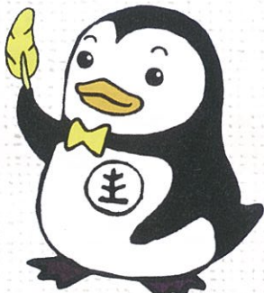
更生ペンギンの ホゴちゃん

保護司は、地域で更生保護の活動を担う民間のボランティアです。罪を犯して保護観察を受けることになった人の生活を見守り、様々な相談にのり、時には助言を行います。犯罪を予防するための地域活動に取り組んでいます。